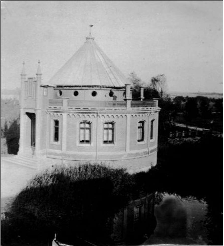
Die prachtvolle Sternwarte im Stil der Neugotik am Bothkamper See, ca. 1930

1893 verstarb der Gutsherr und um die Forschungsstätte wurde es stiller, bis schließlich 1914 die Arbeit in der Sternwarte endete.