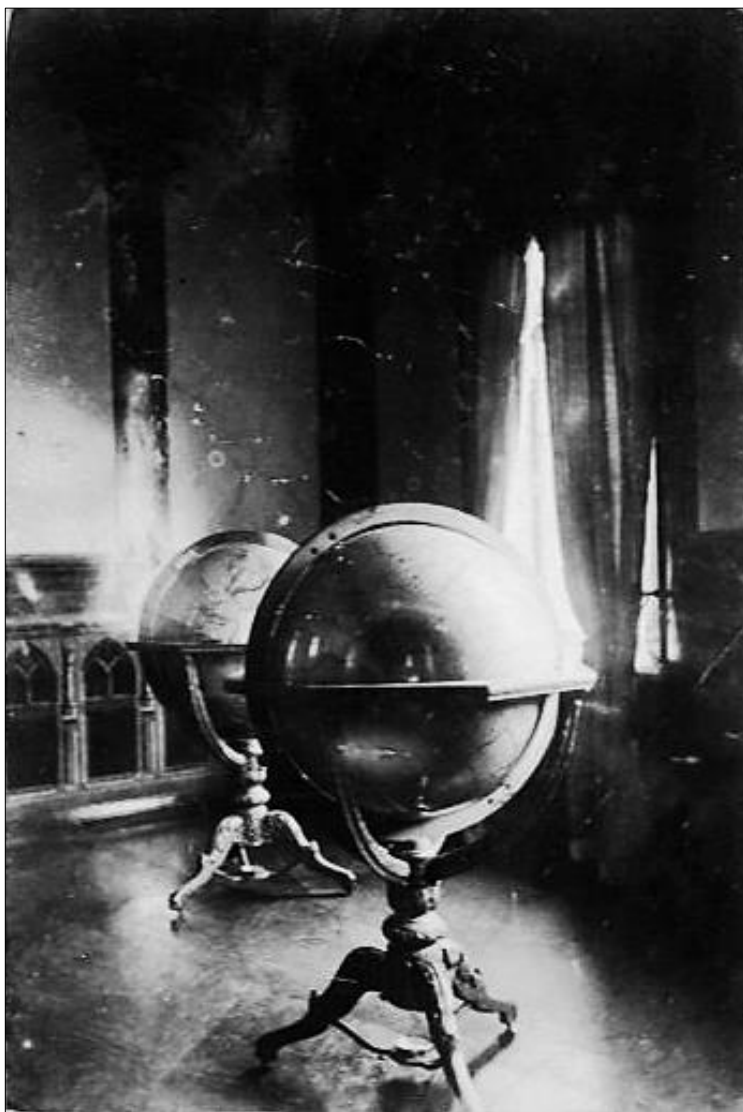
Erd- und Himmelsglobus in der Rotunde, ca. 1900

Sternwarte, nur noch das Fundament blieb erhalten und ist heute noch sichtbar.