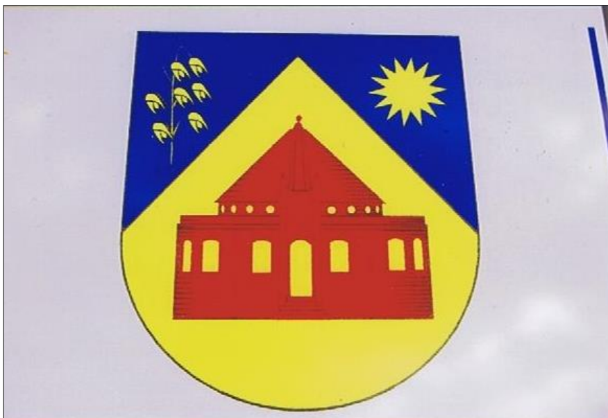
Wappen der Gemeinde Bothkamp, Kreis Plön, vom 18.04.2005