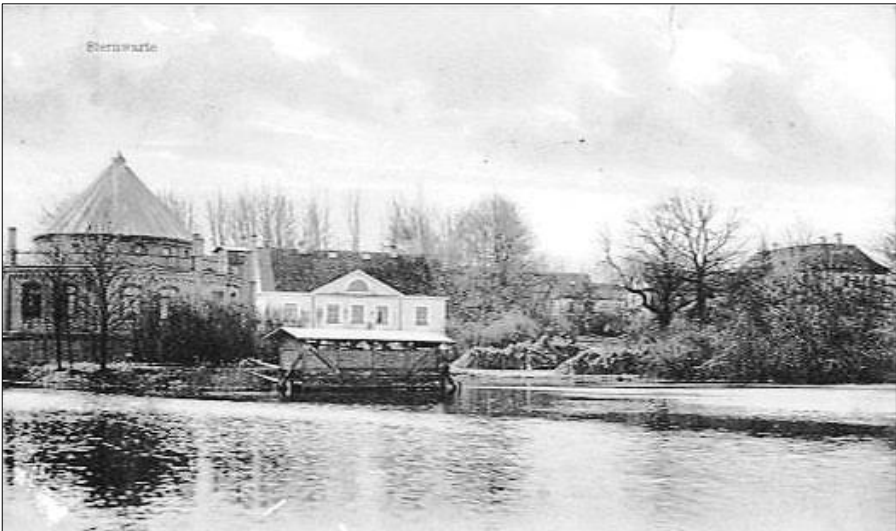
Gruß aus Bothkamp 1912

Der Bau einer Sternwarte im Jahre 1869 auf Initiative des Gutsherrn Friedrich Gustav von Bülow war zur damaligen Zeit eine Sensation und sollte durch Neuentdeckungen im Sternenhimmel berühmt werden.