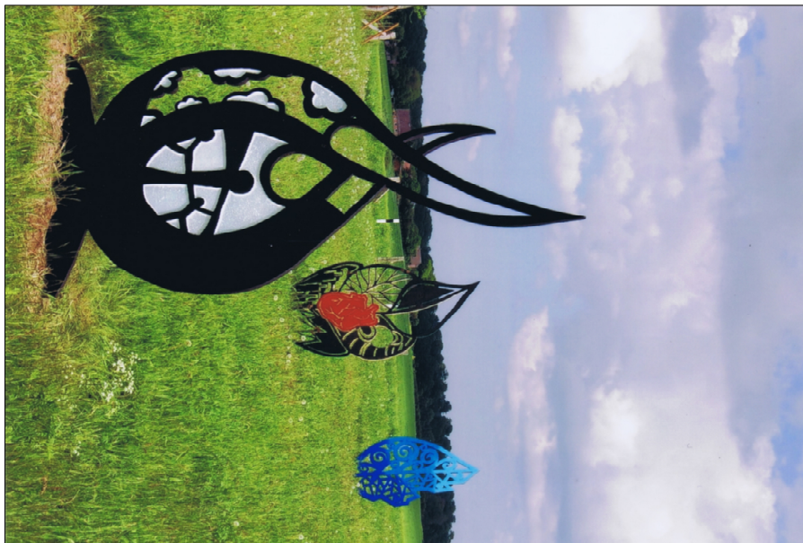
Links und rechts: 2013