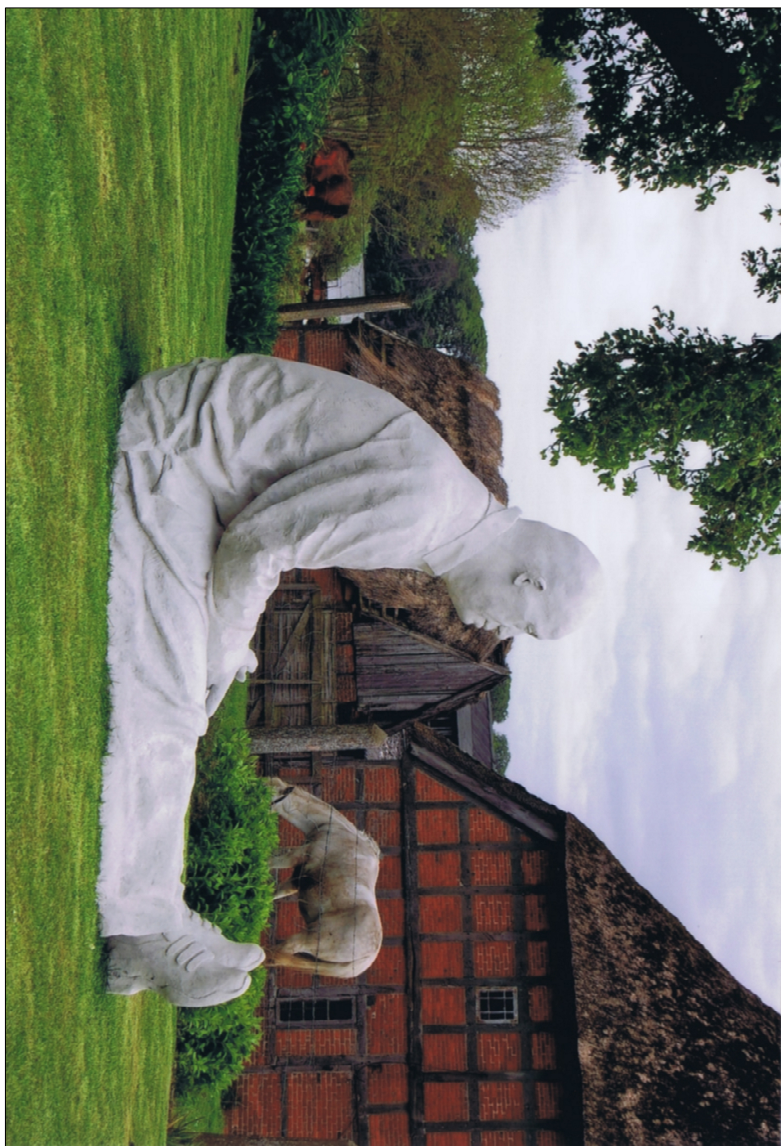
Eine gelungene Symmetrie zwischen Kunst und Natur. Die Figur strahlt Ruhe aus und ist zufrieden mit sich und der Welt (2014)